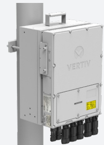
Mastmontage, flache Position