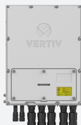
Wandmontage, flache Position